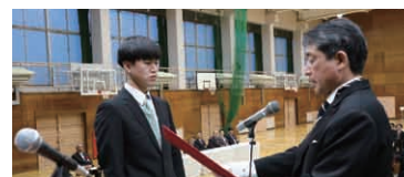
上段左から 生徒生活体験発表大会/スーツ着こなし講座/球技大会