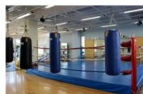
ボクシングリング・トレーニング室