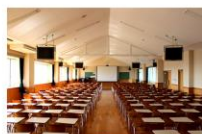
プレゼンテーションルーム