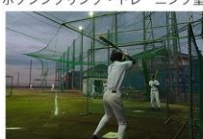
第2グラウンド 本校から徒歩3分